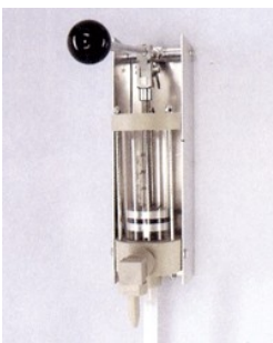
Hånddoseringspumpe. Type 500 ml Monofiber varenummer 026-0500