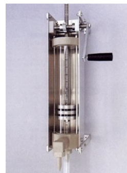
Hånddoseringspumpe. Type 1000 ml Monofiber varenummer 026-1000